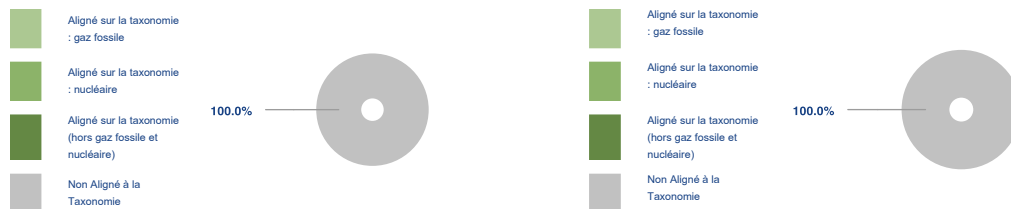
Ce graphique représente 100% du total des investissements.

Les deux graphiques ci-dessous font apparaître en vert le pourcentage minimal d'investissements alignés sur la taxonomie de l'UE. Étant donné qu'il n'existe pas de méthodologie appropriée pour déterminer l'alignement des obligations souveraines* sur la taxonomie, le premier graphique montre l'alignement sur la taxonomie par rapport à tous les investissements du produit financier, y compris les obligations souveraines, tandis que le deuxième graphique représente l'alignement sur la taxonomie uniquement par rapport aux investissements du produit financier autres que les obligations souveraines.